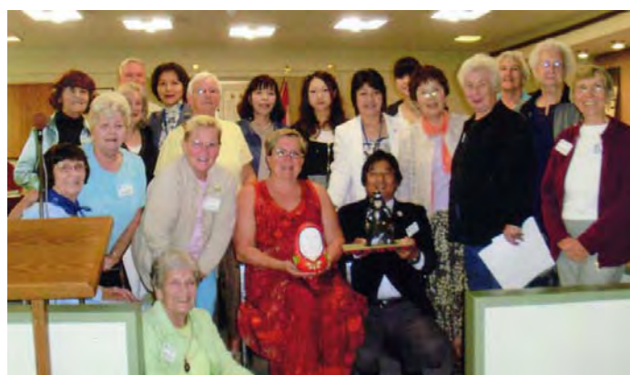
ペンティクトンの市役所にて（中央が副市長さん）